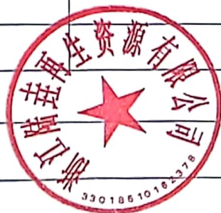
表 2 废物运输情况