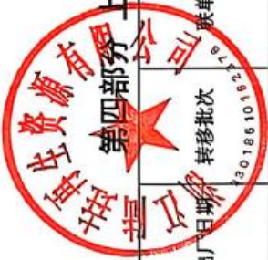
第四部分 上年度固体（危险）废物跨省转移情况